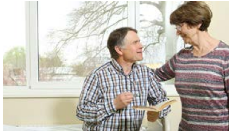
Modernes Ambiente, komfortable Patientenzimmer Bei uns sind Sie auf allen Stationen gut aufgehoben

Haben Sie weitere Wünsche, Anregungen oder auch Verbesserungsvorschläge, teilen Sie uns dies gern mit.