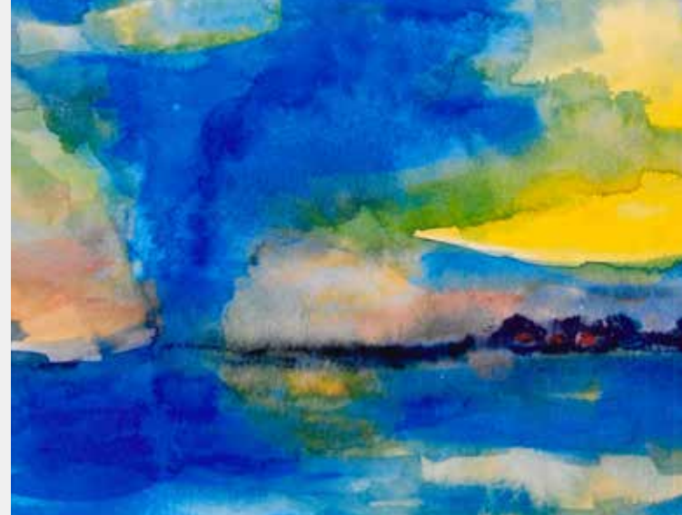
Patientenbild, entstanden in der Kunsttherapie

Vielen Dank für ihr Vertrauen. Ihr Team der Psychoonkologen